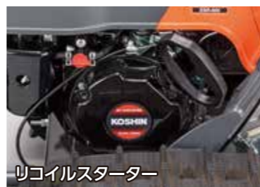
リコイルスターター