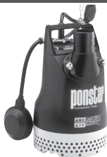
高さ308mm×幅390mm(フロート使用時)